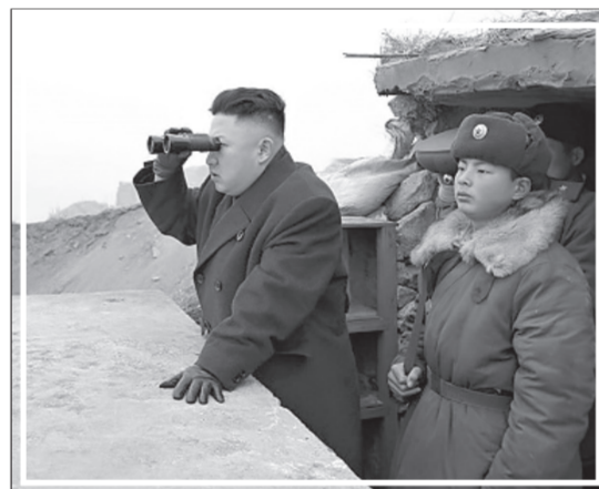
Угроза Ким Чен Ына: КНДР испытала новое баллистическое оружие

Поскольку история не останавливается, новые войны продолжают зреть. И ввиду существования в природе ядерного оружия грозят миру катастрофичными последствиями. Западный мир осознал с большим опозданием, что был спасён Израйлем, разбомбившим 7 июня 1981 года находившийся на грани запуска иракский ядерный реактор «Осирак». Этот реактор, предназначенный для производства плутония, создала Саддаму Хусейну Франция. По оценке советских экспертов, при наличии специалистов с помощью этого реактора Ирак в 1983 году мог бы произвести 3 атомные бомбы, а в 1985 году — уже 5 бомб. Совет Безопасности ООН осудил Израиль за агрессию, а Рональд Рейган наложил на Израиль санкции, приостановив доставку оружия.