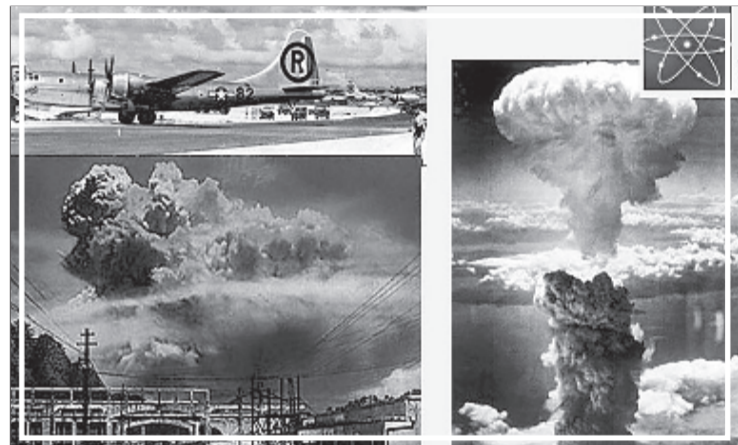
Страшно подумать, но если бы не бомбёжка Хиросимы и Нагасаки, количество жертв войны среди населения Японии, а также воюющих с ней армий, измерилось бы миллионами

У тех вскоре появится и своя бомба — благодаря Обаме и его, по выражению Трампа, «позорнейшему», худшему из когда-либо заключённых договоров — с исламистским Ираном. Переговоры с мullahами Обама поручил той же Венди Шерман, столь продуктивно поработавшей по поручению Клинтона в Северной Корее. Сенат США был в состоянии блокировать договор Обамы, но среди его