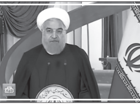
Роухани угрожает Америке и Израйлю

Ещё более зловеще, чем северокорейская, угроза иранской экспансии и его ядерной программы. Воспользовавшись деньгами, предоставленными мullahам Обамой, а также благодаря снятым с Ирана санкциям, Исламская республика устанавливает своё доминирование по всему Ближнему Востоку. Иран контролирует Ирак, Си-