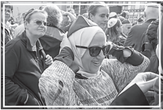
Мусульманки надевают киту на акции против антисемитизма в Эрфурте