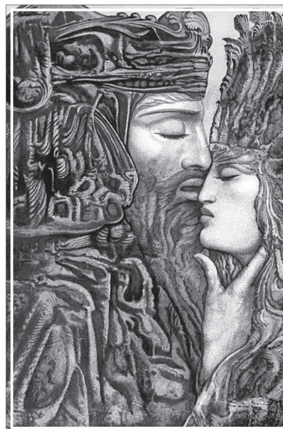
«Давид и Вирсавия», Эрнст Фукс

Уважаемые дамы! Разрешите представить вам прекрасную незнакомку, женщину удивительной красоты и не менее удивительной судьбы. Женщина, которая жила в эпицентре событий и повлияла на ход истории Древнего Израиля. Итак, начнем. Предлагаю вам мысленно перенестись эдак на три тысячи лет тому назад в древний Израиль Эпохи Царей. На троне восседает могущественный правитель Давид сын Ишая из колена Иехуды. Давайте сформируем виртуальную туристическую группу и... войдем в Яфские ворота (других тогда еще не было) столичного града Иерусалима. Оговорим сразу, что это не тот «Иерусалим шель загав», о котором мы вместе с вами дружно поем на наших праздниках. Городу уже не исполнилось и 10 лет. Еще слышен ханаанейский говорок Иевусев, местных аборигенов, но все мощнее звучит хор голосов, звучащих на лашон-кодеш — языке священного писания. Наше путешествие начинается от королевского дворца в южной части города, чуть ниже священной вершины горы Сион. Это первый монументальный проект в величественной финикийской манере. Царь Финикии Хирам послал Давиду архитекторов и строителей, которые из Ливанского кедр и Иерусалимского камня возвели это грандиозное сооружение.