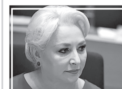
Премьер-министр Румынии Вioreк Дачилэ

По словам политика, она постарается использовать время председательства Румынии в Совете ЕС для того, чтобы «укрепить взаимоотношения между Израилем и всем Евросоюзом». Таким образом, Румыния станет единственным членом ЕС, решившим перенести посольство из Тель-Авива в Иерусалим. В мае 2018 года Румыния, Чехия и Венгрия заблокировали резолюцию Евросоюза против переноса посольства США из Тель-Авива в Иерусалим. Еще до выступления Дачилэ президент Гондураса Хуан Орландо Эрнандес заявил на конференции о том, что его страна «немедленно» откроет в Иерусалиме дипмиссию. «Гондурас немедленно откроет официальную дипломатическую миссию, которая дополнит посольство нашей страны в столице Израиля, Иерусалиме», – цитирует Эрнандеса израильская газета The Jerusalem Post.