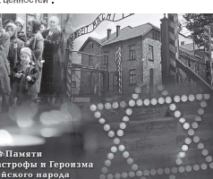
Алиш Хаимати Катастрофы и Героизма еврейского народа

премьер-министр Биньямин Нетанягу коснулся темы борьбы с антимеморией коронавируса. «В отличие от арамов Катастрофы, на сей раз мы впервые заметили опасность и предприняли правильные шаги: мы закрыли границы государства и поставили все властные структуры на борьбу с антимеморией. Мы скорбим о людях, пострадавших Катастрофу и умирающих из-за антимемории коронавируса. Мы переживаем огромное испытание, но оно не может сравниться, ничто не может сравниться с тотальным уничтожением, которое осуществилось в дни Катастрофы», — заявил премьер-министр. Президент Реувен Ривлин в своем выступлении сказал: «В январе этого года в Иерусалиме собрался лидеры разных стран, чтобы еще раз заявить о своем обязательстве передавать их поколения в поколения уроки Катастрофы. Мы вместе озвучили простую, но крайне важную истину: все мировые лидеры, все граждане мира должны быть готовы бороться с антимеморией, расизмом, фашизмом, для защиты демократии и демократических ценностей».