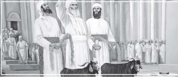
Шаббат 2 мая (8 ияра)