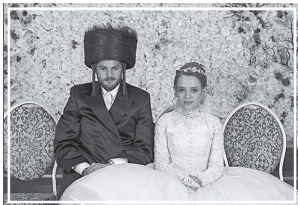
Кадры из сериала «Неортодоксальность»

Так, главная героиня переживает не из Берлина в Нью-Йорк, а наоборот. Задумка состояла в том, чтобы показать современную Берлин, где когда-то зародился Холосток, глазами еврейки.