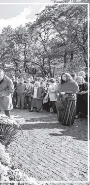
Участники Марша памяти у Меноры в Бабьем Яре