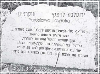
Памятный знак в честь Ярославлы Левницкой в Хайфе

«Также отец, Ярослав Александр Левницкий, предоставлял евреям помещения для празднования Песаха на мельнице...»